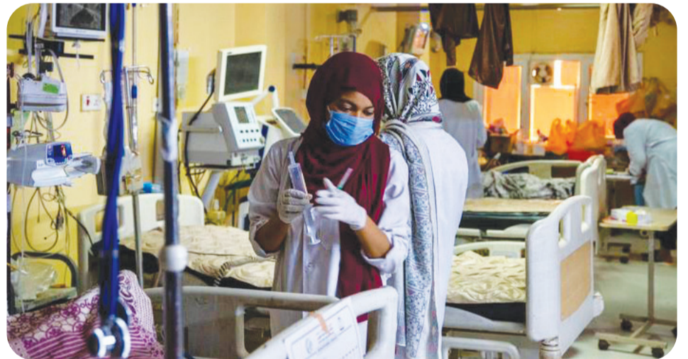
الفرقة الإقليمية للدرك الوطني بلوفاية بسكرة

دعا المدير العام لمنظمة الصحة العالمية الهجمات على قطاع الرعاية الصحية في تيديروس أدهانوم جيبريسوس إلى وقف السودان وإتاحة الفرصة الكاملة لإصلاح الهجمات على مراكز الرعاية الصحية المرافق المتضررة على وجه السرعة». والعاملين فيها في السودان. بعد أن أدى هجوم وقال حاكم دارفور ميني مناوي على مواقع بطائرة مسيرة على مستشفى في منطقة التواصل الاجتماعي، أن طائرة مسيرة تابعة بولاية شمال دارفور إلى مقتل أكثر من 70 لقوات الدعم السريع استهدفت قسم الطوارئ شخصا وإصابة العشرات. وقال تيديروس بالمستشفى الواقع في عاصمة ولاية شمال في منشور على مواقع التواصل الاجتماعي دارفور، مما تسبب في مقتل مرضى بينهم أول أمس السبت، بعد الهجوم الذي وقع يوم نساء وأطفال. وأدى النزاع المسلح بين جيش الجمعة: «باعتباره المستشفى الوحيد العامل السوداني وقوات الدعم السريع والذي اندلع في الفاشر. يوفر المستشفى التخصصي في أبريل 2023 إلى مقتل وإصابة آلاف من للنساء والتوليد خدمات تشمل أمراض النساء السودانيون وتسببت في موجة نزوح ولجوء والتوليد والباطنة والجراحة وطب الأطفال واسعة إضافة إلى أضرار واسعة في البنية إلى جانب مركز للتغذية العلاجية». وأضاف التحتية بالبلاد تيديروس: «نواصل الدعوة إلى وقف جميع