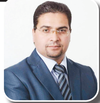
بقلم الدكتور سعد سعد

بعد اقل من أربعة أشهر من انتشار فيروس كوفيد 19 نشرت بحثا مطولا نشرته في الصحافة الوطنية والدولية، تحول فيما بعد إلى كتاب جماعي بعنوان « كوفيد 19 والمتحور: دراسة في الإبعاد التاريخية والإعلامية والمستقبلية » شاركني فيه مجموعة من الدكاترة والباحثين من الجزائر ودل عربية وغربية منهم باحث من أمريكا وآخر من روسيا، الذي تشرفت دار ألفا للنشر والتوزيع بطبعه ونشره في 280 صفحة )