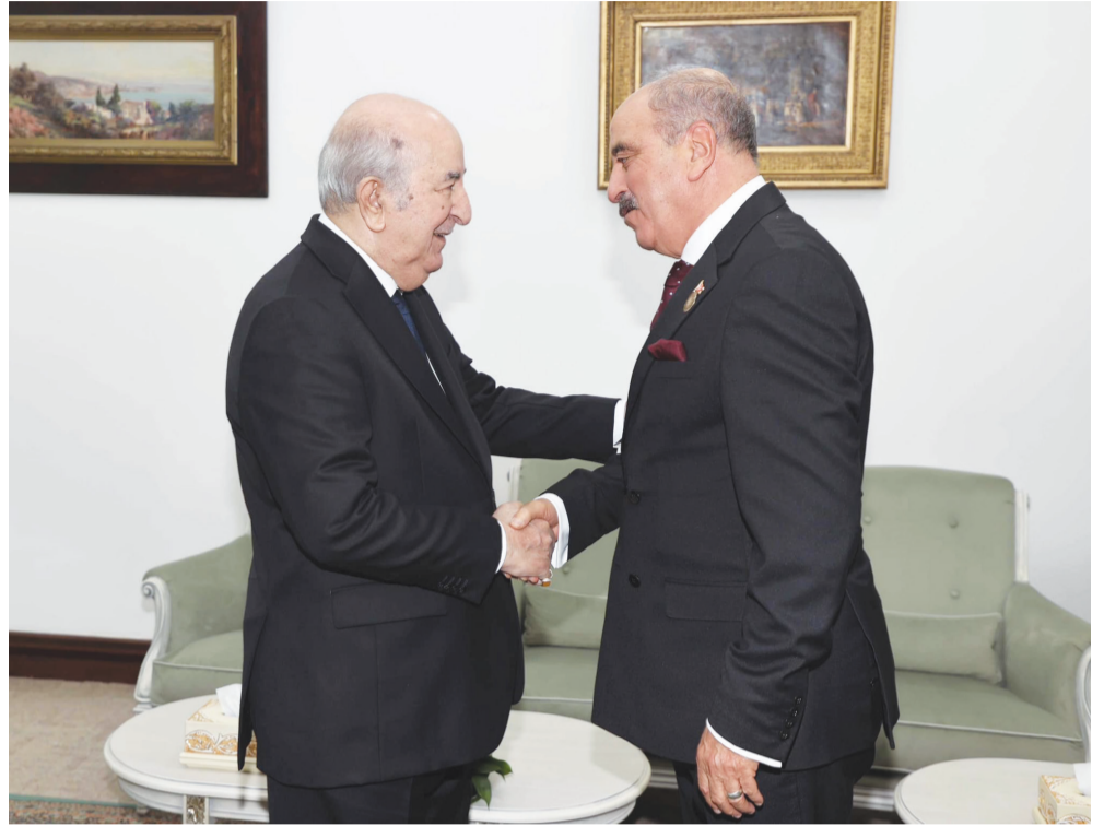
استقبل رئيس الجمهورية عبد المجيد تبون، يوم أمس الاثنين، وزير الشؤون الخارجية والهجرة والتونسيين بالخارج، محمد علي النفطي، والوفد المرافق له، حسب ما أفاد به بيان لرئاسة الجمهورية.

الشقيقة من حرص حقيقي على تعزيز العلاقات الثنائية على مختلف الأصعدة وفي مختلف المجالات». وفي هذا الصدد، تم التأكيد -يضيف الوزير التونسي- على «أهمية وضع خطة عمل ناجعة وطموحة تهدف إلى تعزيز هذا التعاون الثنائي في المجالات ذات الأولوية بالنسبة للبلدين مما يسهم في تحقيق مصالحنا المشتركة ويجسد المزيد من التقدم والأمن والرفاه والتضامن بين شعبينا الشقيقين». ولفت أيضا إلى أنه أطلع رئيس الجمهورية على جدول أعمال اللقاء الذي سيجتمع بوزير الدولة وزير الشؤون الخارجية والجمالية الوطنية بالخارج والشؤون الإفريقية، أحمد عطايف، معربا عن أمله في أن تسهم خطة العمل التي سيتم وضعها في «تعزيز التعاون الثنائي والدفع به نحو ما نصبو إليه جميعا من شراكة استراتيجية تشمل كافة الأصعدة من خلال التحضير للاستحقاقات الثنائية المقبلة». على صعيد آخر، شكل اللقاء مناسبة تم خلالها «التطرق لمجمل القضايا العربية والإفريقية ذات الاهتمام المشترك»، وهو ما يعكس ويجسد -مثلما قال النفطي- «سنة التشاور التي دأب عليها البلدان وقيادتهما من أجل تعزيز مساهمتهما في تدعيم أركان الأمن والاستقرار والتنمية المتضامنة في منطقتنا وفي العالم بأسره».